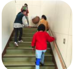
小さな思いやりがさらに育っていくことを願います。

3、4年生と高齢者疑似体験等を行い自分たちができることを考えてもらいました。「車いすを押してあげる」「荷物をもってあげる」ほかに、「大人の人を呼ぶ」。地域の大人を信頼している姿や、福祉を真剣に学ぶ様子が印象的でした。